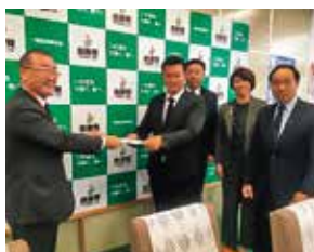
自由民主党・道民会議

現在、すでに32府県で実施されていますが、北海道は企業や人材の札幌圏一極集中や産業界等との調整を理由に進展していません。