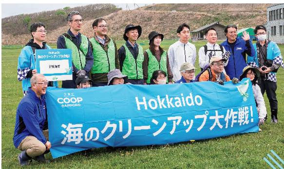
協同組合ネット北海道事務局メンバー